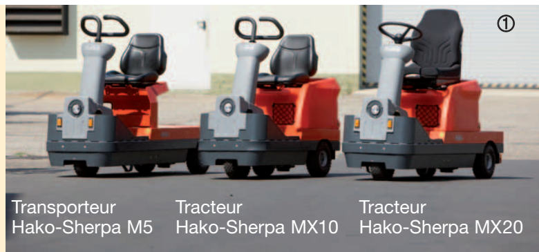
Transporteur Hako-Sherpa M5

Sous réserve de modification de la forme, de la couleur et du design dans l'intérêt du développement technique.